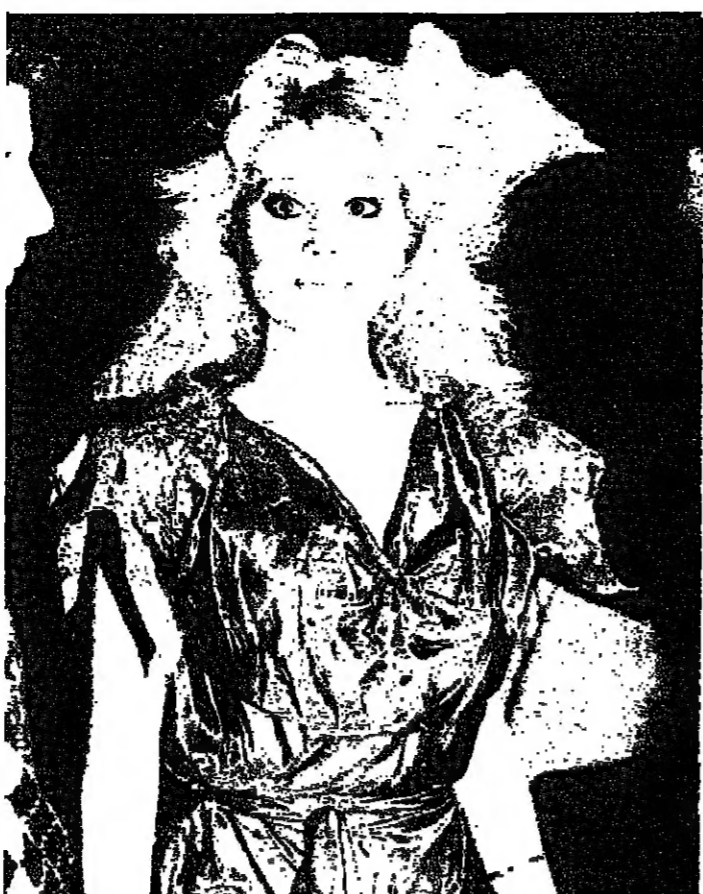
باتالفا الى القارة القديمة عبر مسلسل جديد تقوم به للتلفزيون الاربوبي. وهنا تيدو اوبري مع والديها روث.